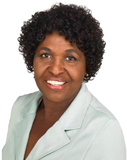
BENEDITA DA SILVA

Deputada Federal, filiada ao Partido dos Trabalhadores