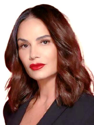
LUIZA BRUNET Empresária