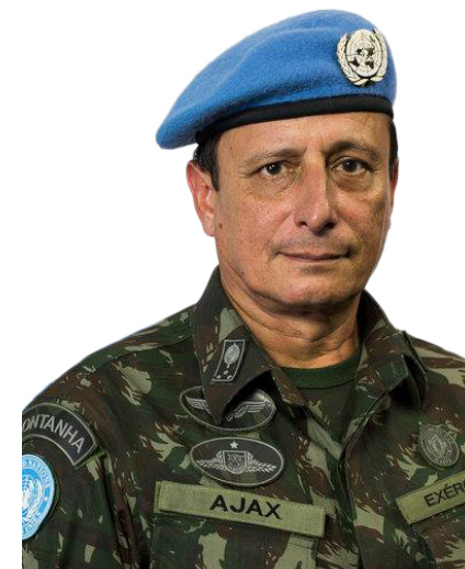
AJAX PORTO PINHEIRO

Vereador do Rio de Janeiro Comunicador na rádio melodia