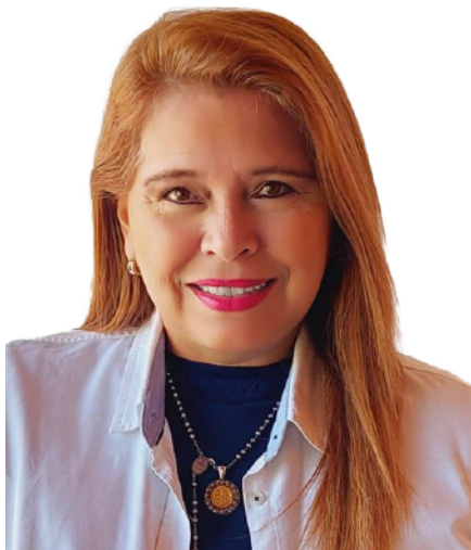
MIRTHA PALACIOS Senadora Paraguuaia