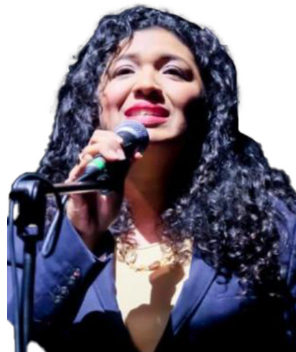
GISELA PERES Represente do Governo Bogotá