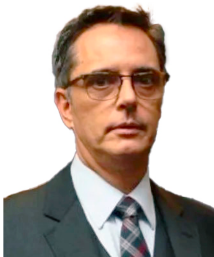
CELSO RICARDO PEEL FURTADO

Desembargador do Tribunal Regional do Trabalho da 2ª Região - SP